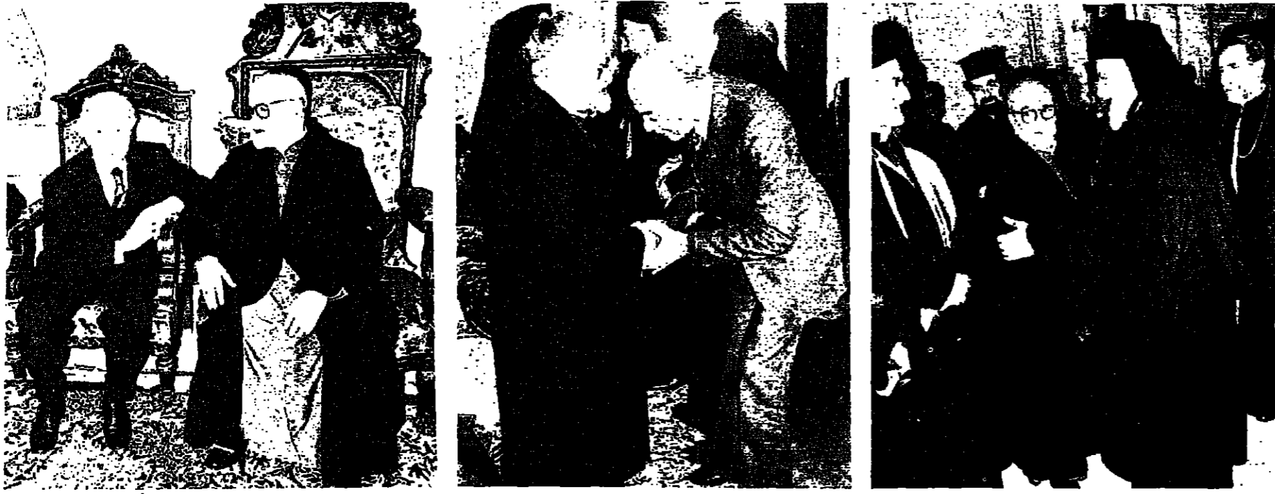
في الصلوة الكبري غبطة البطريك خريش يتقبل تهاني... صاحب الغبطة البطريك خريش يتقبل تهاني الشخ... غبطة البطريك مكسيوس حاكم يتم تهاني الطائفة الكاثوليكية... غبطة البطريك الماروني ماراطون بطرس خريش... في الصلوة الكبري غبطة البطريك خريش يتقبل تهاني... الرئيس عبد الله البياي